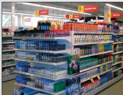
■ Небольшой продуктовый магазин