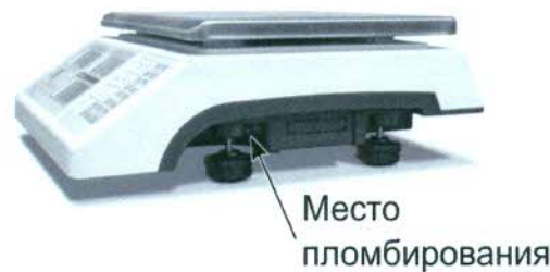
Рисунок 2 – Схема пломбировки весов, обозначение места нанесения знака поверки

Весы изготавливаются однодиапазонными, двухинтервальными и трехинтервальными восьми модификаций с обозначениями: 3-1; 6-1.2; 6-2; 15-1.2.5; 15-2.5; 15-5; 30-5.10; 30-10, отличаются значениями максимальной нагрузки (Max) и значениями поверочного интервала (e).