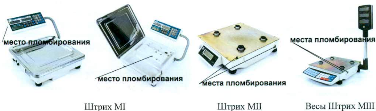
Рисунок 2 – Места пломбирования весов

– на весах Штрих МII и Штрих МIII – под ГПУ на корпусе весоизмерительного устройства.