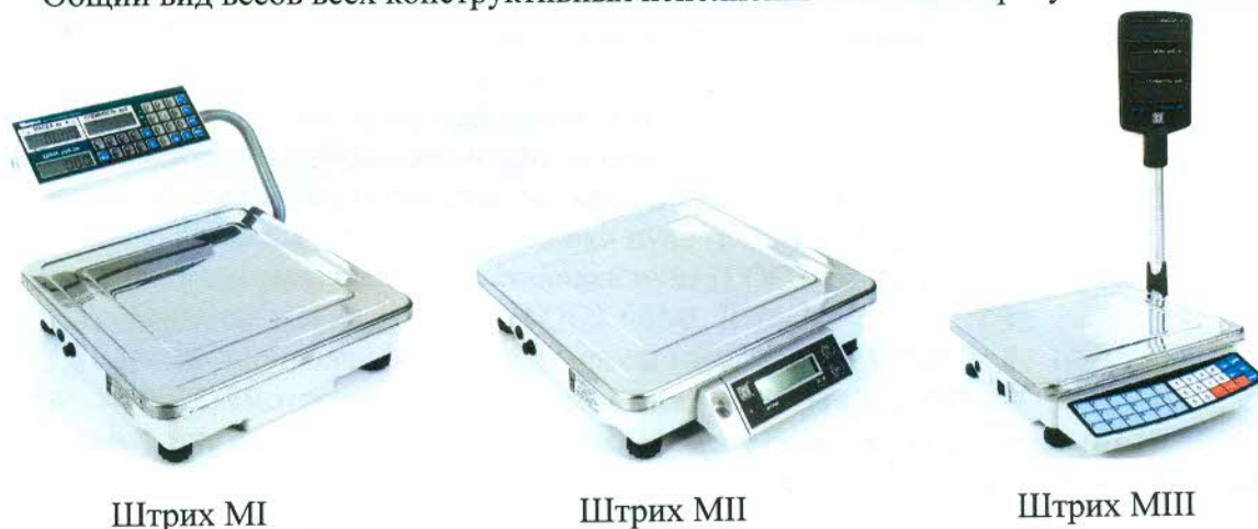
Рисунок 1 – Общий вид весов электронных Штрих М

Общий вид весов всех конструктивных исполнений показан на рисунке 1.