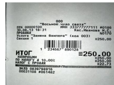
Чек со штрих кодом

Рассказывайте об акциях и привлекайте покупателей — красивые чеки, напечатанные фискальным регистратором "Retail-01K", покупатели внимательно разглядывают и часто берут с собой, чтобы не забыть купить товар со скидкой.