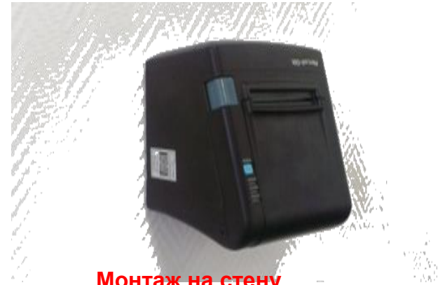
Монтаж на стену

Одним из преимуществ устройства является несколько вариантов монтажа: он может устанавливаться как горизонтально, так и для экономии места на кассовом узле фиксироваться крепёжными винтами в вертикальном положении и под любым углом наклона.