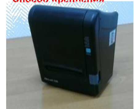
Работает под любым углом