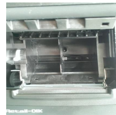
Ограничитель для печати на узкой ленте от 57мм