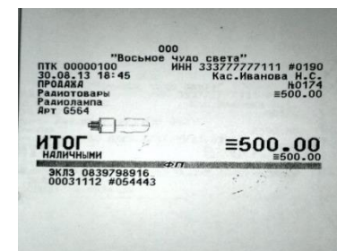
Чек с графикой