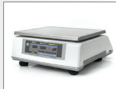
Встроенный дисплей покупателя