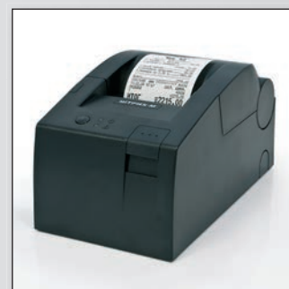
В черном корпусе

При переходе от упрощенной системы налогообложения к стандартной, торгующие организации могут доработать уже эксплуатируемые АСПД до ККМ с помощью комплектов доработки, а не приобретать новый фискальный регистратор, что гораздо выгоднее экономически. Комплекты доработки созданы для всех моделей АСПД производства компании ШТРИХ-М.