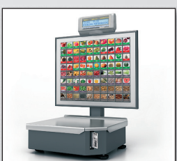
■ «ШТРИХ-ПРИНТ» С