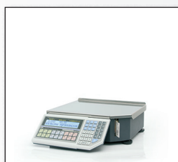
■ «ШТРИХ-ПРИНТ» Ф1

Серия весов с печатью этикеток «ШТРИХ-ПРИНТ» 4.5 — превосходная комбинация привлекательного дизайна (эстетичного и практичного) и качественной обновленной электроники. Производство, фасовка, работа через прилавок, самообслуживание в торговом зале, торговля мясом и рыбой — вот неполный перечень сфер применения, где могут работать весы «ШТРИХ-ПРИНТ» 4.5. Линейка наших весов сегодня включает в себя 5 моделей.