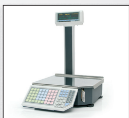
■ «ШТРИХ-ПРИНТ» М