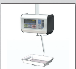
■ «ШТРИХ-ПРИНТ» ПВ

«ШТРИХ-ПРИНТ» Ф1 Исполнение, предназначенное для фасовки товара. Клавиатура и дисплей оператора размещены внизу. Дисплей покупателя не предусмотрен.