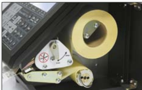
■ УДОБНАЯ ЗАГРУЗКА

На типовом варианте этикетки кроме необходимой информации о товаре указаны: