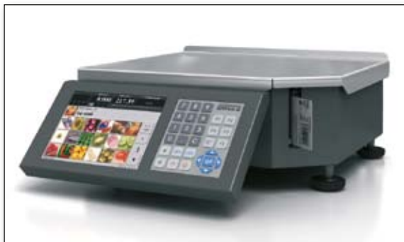
■ ИСПОЛНЕНИЕ BENCH

Вид оборудования: весы с печатью этикетки со встроенным компьютером