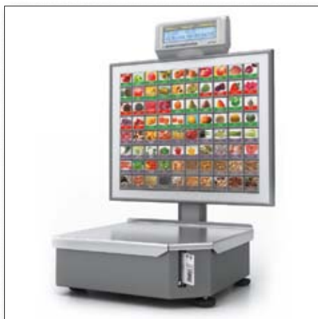
■ ШТРИХ-ПРИНТ С