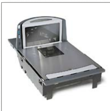
■ Datalogic 8300/8400 «Magellan»

Конструкция «Штрих-ВМ-100» позволяет конфигурировать с лазерными сканерами Datalogic (ВМ-100А) и Honeywell (ВМ-100В)