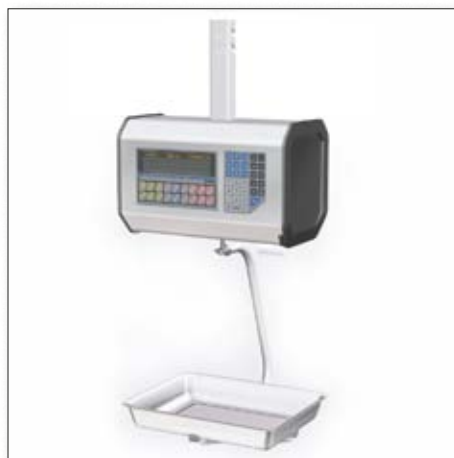
■ ШТРИХ-ПРИНТ ПВ

«ШТРИХ-ПРИНТ С» — специальное исполнение весов серии «ШТРИХ-ПРИНТ v.4.5» для магазинов самообслуживания, где взвешивание и этикетирование весового товара выполняется покупателями самостоятельно. Для максимального удобства кнопки клавиатуры имеют большие размеры и снабжаются сменными вкладышами с картинками и наименованиями товаров. Весы предназначены для установки в отделах замороженных продуктов, овощей, фруктов и кондитерских изделий.