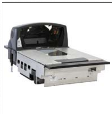
■ Honeywell 2420/2430 «Stratos»