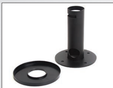
Надежная фиксация стойки