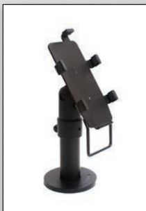
■ Verifone Vx820