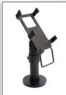
■ Hypercom T4200