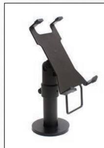
■ Hypercom P2100