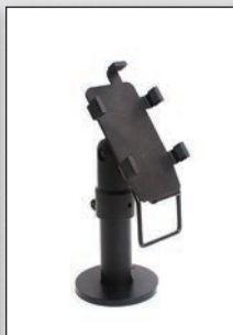
■ Verifone Vx810