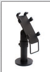
■ Ingenico iPP320/350