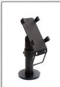
■ Ingenico iCT220